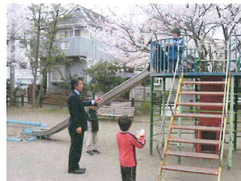
子どもたちにツケを回してはならない...

今回の補欠選挙の結果をしっかりと受け止めて、これからの高齢者医療の負担のあり方について、改めて論議を深めていくことができれば、今回の惨敗も、将来に向かって生きていくことでしよう。 先月末に再可決されたガソリン税の暫定税率の問題につきましては、これまで「月刊さいとう健」で何回か取り上げてまいりましたが、一体どこまで道路を作っていくべきなのかという点を冷静に詰めていけば、 結果として、いくら必要かが決