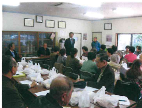
しっかりと説明していく責任。

ザ・クレストホテル柏 (4F クレストルーム) 千葉県柏市末広町14-1 ※柏駅西口より徒歩2分 04-7146-1111(代表) ※ご不明な点がありましたら、さいとう健事務所までご連絡下さい。 ※駐車場は有料となります。電車でのご来場をおすすめします。