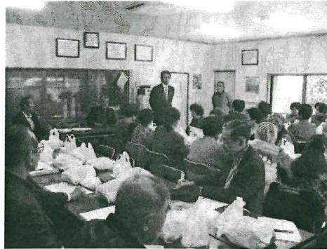
しっかりと説明していく責任。

※ご不明な点がありましたら、さいとう健事務所までご連絡下さい。 ※駐車場に限りがございます。電車でのご来場をおすすめします。