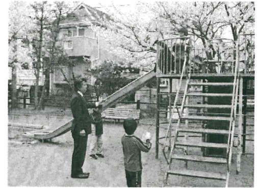
子どもたちにツケを回してはならない...

5歳以上の方々に1割だけ負担して欲しいというものです。そして、残りの4割は若い世代が払う保険料、5割を税金でまかなおうというものです。 この考え方そのものは、さいとう健は、そう不当なものとは思っておりませんが、いかんせん、説明不足です。 政権政党とは、本当につらいものです。国民の皆様が嫌と思われることでもやらなくてはなりません。 しかし同時に、国民の皆さんの声は真摯に聞かねばなりません。