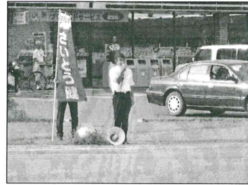
時局の政治課題は街頭で考えをお伝えしています

※今月号の「月刊さいとう健」は、田原総一郎氏について書きましたが、後期高齢者医療制度の問題や道路特定財源につきましても、5月号で触れています。 ご関心のある方は、さいとう健のホームページよりダウンロードすることができます。