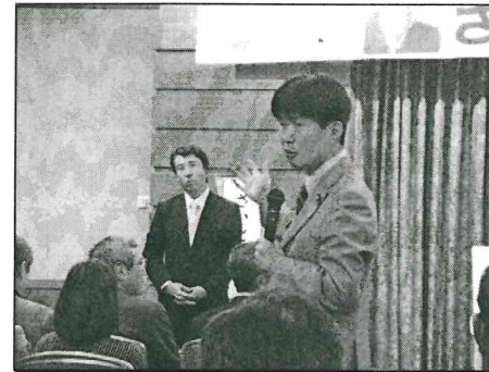
自民党再生に向け熱く語りました (5/25)

先月25日、参議院議員の山本一太氏（自民党）を招いて生対談を行いました。テレビで発言する氏と違い、面白いトークや真剣な眼差しに会場の皆さんから、非常に温かいご声援をいただくことができました。 自民党にも、責任感をもって改革に取り組む若手がいるということとを皆さんにわかっていただけたのではないかと思います。